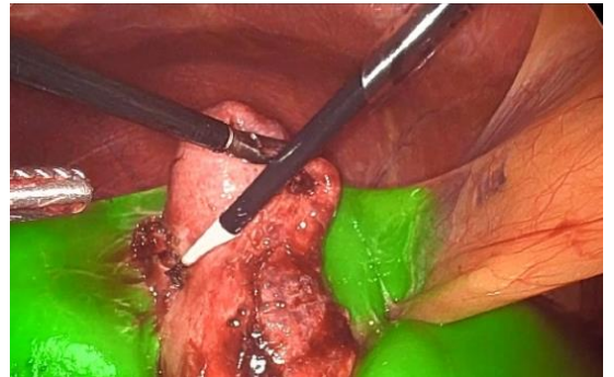
腹腔鏡下胆のう摘出術

当院には内視鏡および腹腔鏡に精通した外科専門医3名が常勤しております。更に、自治医科大学附属さいたま医療センター消化器外科から2名の外科医が応援にきており、非常に恵まれた環境とクオリティーで手術を行っております。腹腔鏡手術に関して高いレベルで治療を提供しておりますが、当院の目指すところは手術のみではありません。現在ではより早期発見できれば胃癌・大腸癌は内視鏡治療で治癒することが可能になっています。そのためには定期的な内視鏡検査が不可欠です。毎年の健康管理に、是非当院の医療資源（内視鏡検査・CT検査・MRI検査など）を積極的に利用していただきたいと思っております。これまで以上に、消化器癌でお亡くなりになる方が一人でも少なくなるように、職員一同全力で取り組んで参ります。