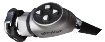
ストライカー社 1688AIM 日本初の4Kカメラシステム モニター(上) カメラヘッド(下)